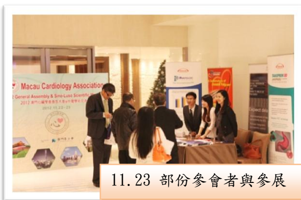
11.23 部份參會者與參展